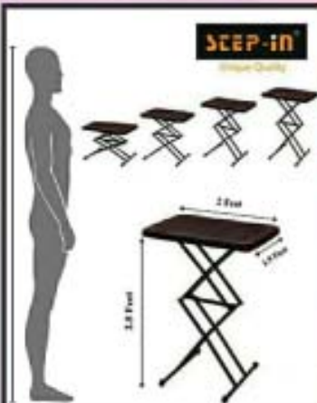
(CLD-5104) FIBER BODY

new quality product.. free Home delivery..